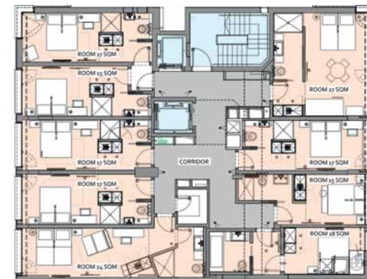
קומת חדרים טיפוסית