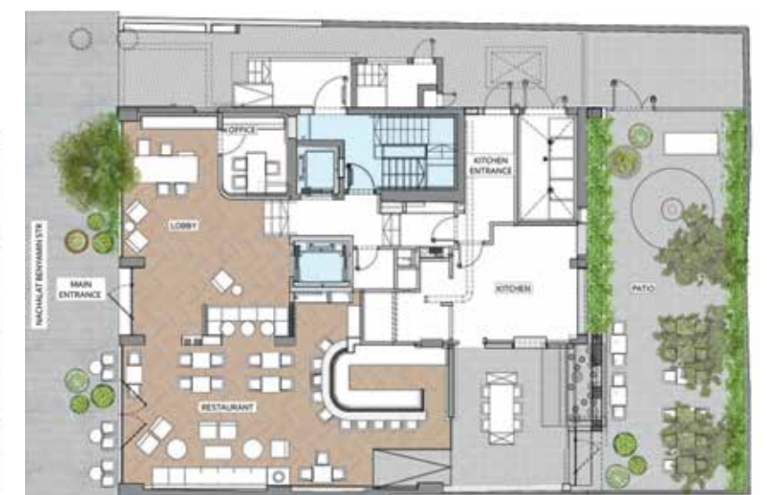
מפלס הרחוב לובי-מסעדה-בר-חצר-אחורית