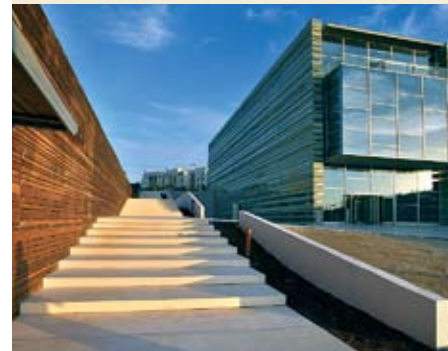
מרכז פרס לשלום. אלפי שעות עבודה

מ סר רכש עבור חבר שני בניינים לשימור בת"א. באחד הבניינים יוקם מלון בוטיק יוקרתי, שייפתח בעוד שנה וחצי בכיכר המלך אלכס, בהשקעה של 25 מיליון דולר. "המלון צריך להיות מאוד סקסי, כיפי. אני עובד כבר חמש שנים כדי להפוך את זה לבאזז. הקונספט פונה לתיירים שרוצים לגור בלב העיר ההיסטורית, ולא רק על שפת הים במלון של רשת. זהו המלון היוקרתי הראשון בלב ת"א. הפרויקט מאתגר מבחינתי מאחר והוא משלב רישוי מיוחד, שימור, מלונאות, עיצוב פנים וניהול". את המפגש בין ערכים לארכיטקטורה אפשר לראות בבית פרס לשלום, שתכנן מסר על חוף הים של יפו, והושקעו בו 50 מיליון שקלים ואלפי שעות עבודה. "אפשר לבנות מבנים מדהימים, אבל בלי שאנשים יסתובבו בהם, אין להם ערך", אומר מסר. "בית פרס לשלום משמר את הדוקיום. התחלתי בפרויקט לפני עשר שנים, יחד עם האדריכל מיסימיליאנו פוקסט, והפכנו משהו אבסטרקטי וקונספטואלי למבנה נוכח ומשפיע. זהו הישג אדריכלי ברמה בינלאומית, ביכולת לקחת רוח ולהפוך אותה לחומר. הבניין עומד על ערכים אוניברסליים של אור וים, הוא מקרין על הסביבה, והסביבה מקרינה עליו".