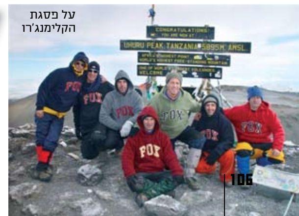
על פסגת הקילימנג'רו

זה התחיל לפני 10 שנים, כשחבר הציע לו לטפס אל פסגת הקילימנג'רו בטנזניה. "הצטרפתי עוד ועוד חברים, והתגבשה קבוצה שאת חלקה לא הכרתי לפני כן. הטיוול היה אתגרי, הטיפוס היה מרגש, ואנחנו היינו מאושרים. מהנקודה של החוויה הזו התלכדנו, והחלטנו שכל עוד אנחנו מסוגלים לעשות את זה, נמשיך. מאז, התגבשנו לקבוצה של גברים לא צעירים, ויחד אנחנו יוצאים למסעות שיש בהם סוג של אקסטרים. אנשים, מנהלים, יומים, שלא חסר להם כסף ובכל זאת בוחרים לעשות טיולים צנועים בתקציב של עד 2,000 דולר, בתנאים קשים, לישון בתנאי שדה".