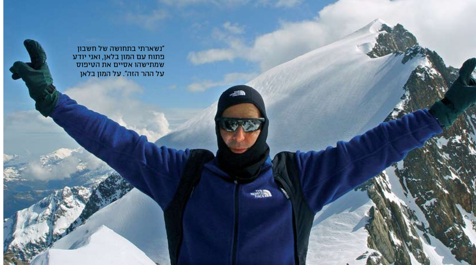
"נשארתי בתחושה של חשבון פתוח עם המון בלאן, ואני יודע שמתישו אסיים את הטיפוס על ההר הזה". על המון בלאן

בבית. "הם אנשים מדהימים, שמביאים איתם את הידע, היכולות והמטענים שלהם מהחיים, וביחד אנחנו נחשפים לעוד ועוד רברים".