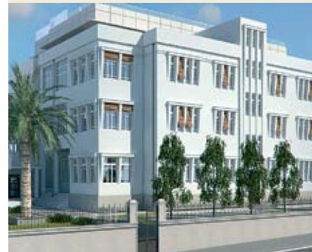
הממית מלון המלך אלברט בת"א. ייצור באזז