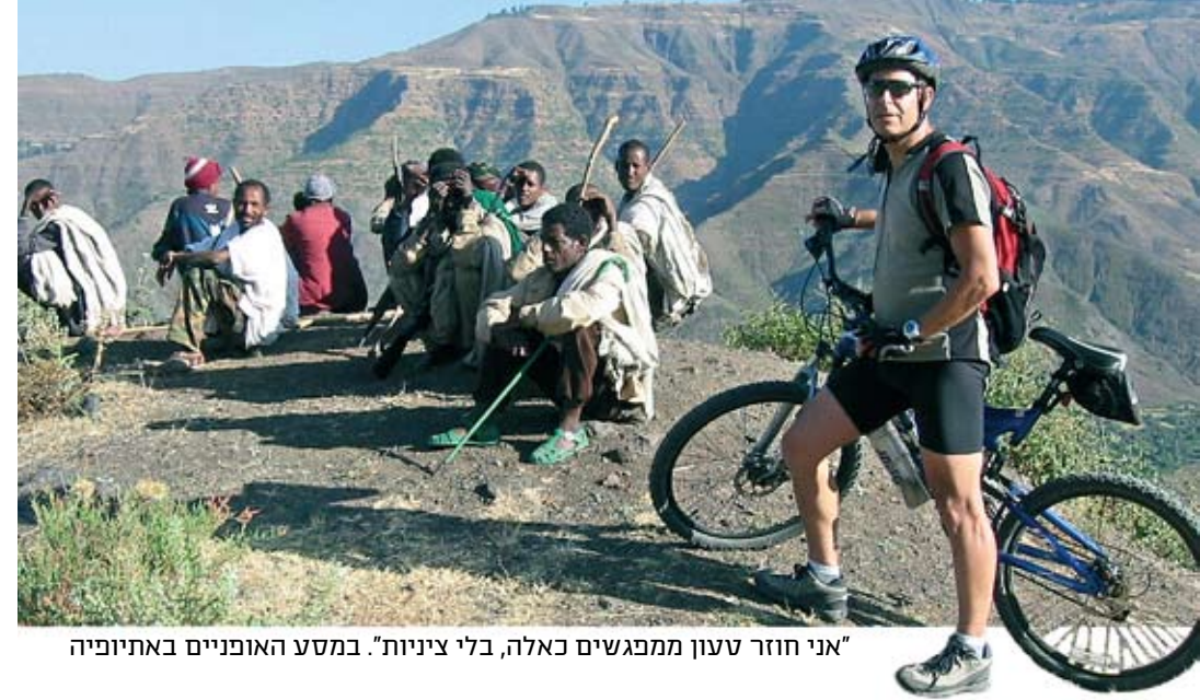
"אני חוזר טעון ממפגשים כאלה, בלי צנינות". במסע האופניים באתיופיה

אדריכל עסוק, חובב אמנות וחבר בהנהלת מוזיאון ינקו דארא בעין הוד, יודע את זה. "ואני מאמין שהחיים זה כאן ועכשיו וצריך לשנות את החשיבה – לחשוב למה כן לנסוע, לא למה לא". את תפיסת העולם הזו הוא החיל לכל משפחתו. אשתו, ורדה, היא סקיפריט שיוצאת למסעות שיט, ויש גם קטגוריה שנקראת "טיול משפחתי לייט". "היינו בקמבודיה, וייטנאם, ולא מזמן נסענו להודו. המרכיב המשמעותי בטילים האלה הוא חוויית היחד".