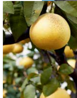
Blick von der Dachterrasse: Hinter den Türmen des Rothschild-Boulevards dunstet das Meer. Zum Selbstpflücken: Grapefruits im Hotelgarten. RECHTS Im Gebäude Nummer drei liegen Suiten mit großen Balkonen.

Jonathan Lourie wirbt ebenfalls für Israel, aber mit heimischen Künstlern. In einer Sitzecke hängt das Gemälde After „Painting 1978“ von Michel